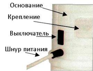
Рис. 3 - Основные элементы рециркулятора 1-115 М, 1-115 МТ, 1-130 М, 1-130 МТ, 2-115 М, 2-115 МТ, 2-130 М, 2-130 МТ, 1-115 П, 1-115 ПТ, 1-130 П, 1-130 ПТ, 2-115 П, 2-115 ПТ, 2-130 П, 2-130 ПТ